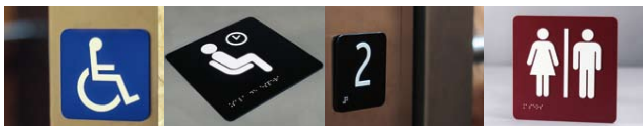
Serie SIA UNE 41501:2002