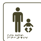
Aseo hombre Cambia pañales