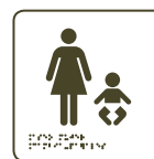
Aseo mujer Cambia pañales