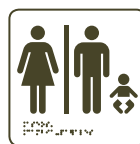
Aseos Cambia pañales